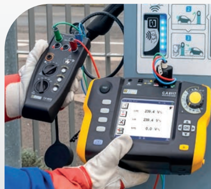
Controllo delle tensioni fornite da un terminale con DDR di tipo B/EV 6 mA, durante la carica.